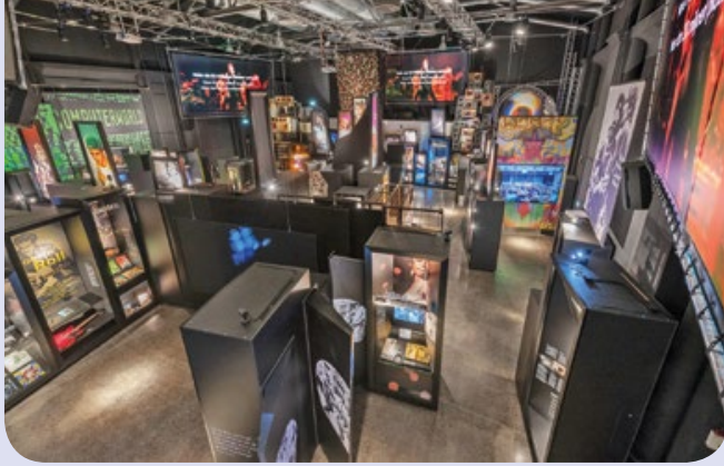
Dauerausstellung „Blick in den Pophimmel“

Der im Frühjahr 2017 gegründete Arbeitskreis (AK) Popmusik und Kirche dient der Wahrnehmung und Wertschätzung der Popmusik und ihrer Erzeugnisse speziell im kirchlichen Kontext. Dies geschieht vor dem Hintergrund der prägenden Kraft von Werken und Künstler*innen der Pop- und Rockmusik auf das Lebensverständnis und -gefühl der Menschen in Kirche und Gesellschaft.