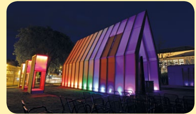
LICHTKIRCHE der EKHN in Wittenberg 2017